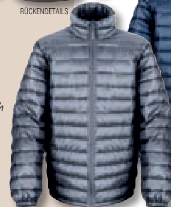
FROST GREY (424) Verfügbar ab den 1. Juli 2014