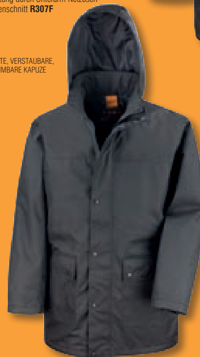
VERDECKTE, VERSTAUBARE, ABNEHMBARE KAPUZE