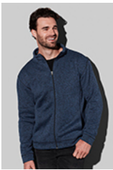
ST5850 Knit Fleece Jacket